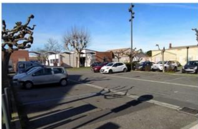
Groupe scolaire Jean Jaurès : un parking voiture, mais aucun aménagement cyclable