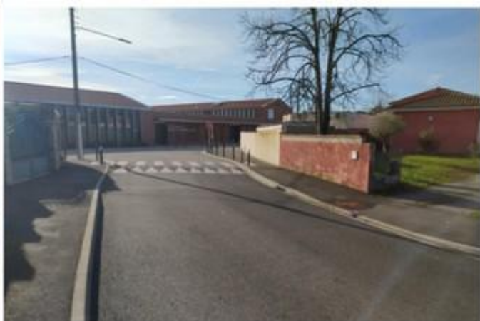
Tout nouveau groupe scolaire Claudie Haigneré = aucun aménagement cyclable