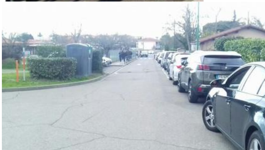
Ecole élémentaire Léon Blum : A l'avant, aucune voie cyclable, et à l'arrière, ancienne piste cyclable élargie et transformée en route accessible aux voitures...

- rond-point Nelson Mandela : Interruption de la piste cyclable dans ce grand carrefour à fort trafic.