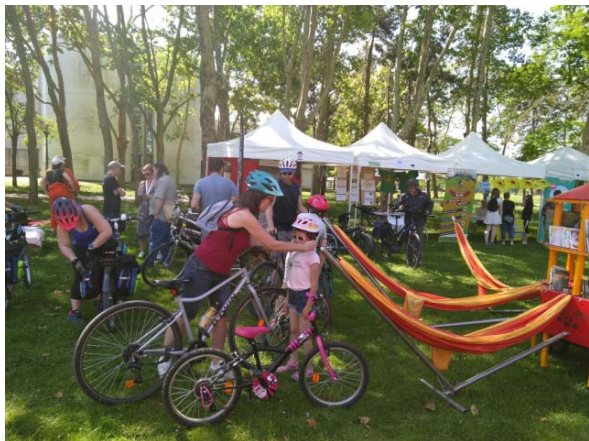
Figure 7: 1 er Ecofestival du Val d'Oise en juin 2019

Nous étions coorganisateur de l'Ecofest en juin 2019 et avons proposé des balades à vélo pour faire connaître le territoire