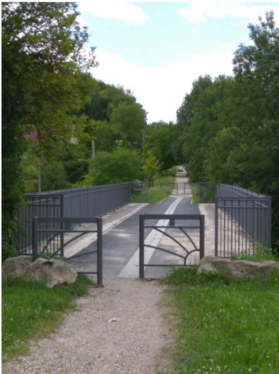
Figure 3: Avenue verte, viaduc au-dessus de la rue de Vallée, Jouy-le-Moutier

L'aménagement de cette véloroute avance doucement, mais il a fallu manifester pour l'obtention du passage inférieur à Sagy, sous la RD 28 et ces travaux sont enfin programmés !