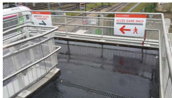
Figure 2 : rampe d'accès à la passerelle : trop étroite, avec un virage trop serré et ... interdite aux cyclistes

A Pontoise, la passerelle au-dessus des voies ferrées, qui est un formidable raccourci pour rejoindre le centre ville depuis Cergy doit être autorisée aux cyclistes.