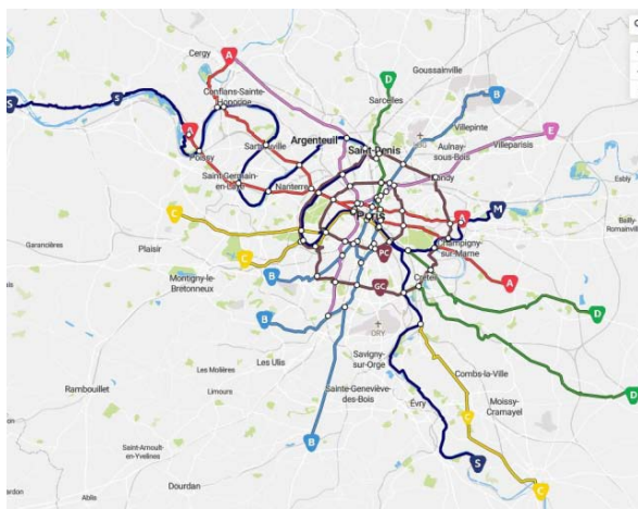
Figure 5 : plan du RER V

Nous avons regardé les tracés de la ligne A qui