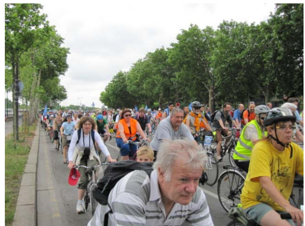
Figure 4 : convergence francilienne

La convergence francilienne a lieu chaque année le premier dimanche de juin. Nous organisons un départ de Cergy depuis la première édition.