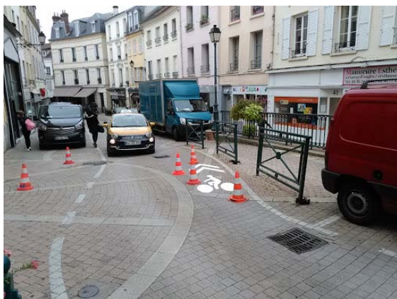
Figure 1 : rue de l'hôtel de ville à Pontoise : devenue cyclable à contre-sens après notre plainte au tribunal administratif

Un vélo doit aussi pouvoir emprunter des circuits plus courts qu'une voiture : à Pontoise, à Osny, les rues limitées à 30 km/h doivent être mises en double-sens cyclables, d'ailleurs c'est la loi ! Pourquoi est-on obligé de passer par un recours au tribunal administratif pour faire respecter cette loi ?