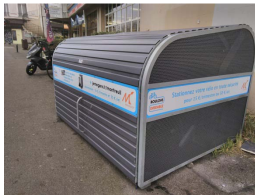
Figure 8 : à Montreuil, on peut garer son vélo pour 15 € par trimestre ou 50 € par an