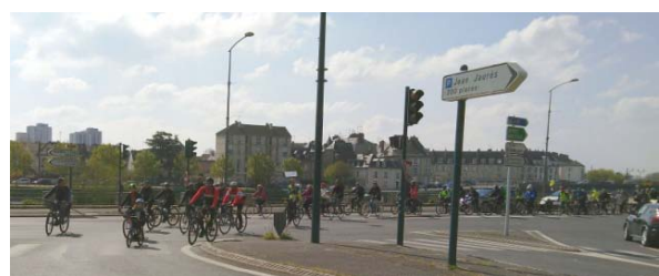
Figure 6 : 1 ère vélorution à Cergy-Pontoise

Nous avons organisé la première vélorution à Cergy-Pontoise en avril 2019, pour faire prendre conscience aux collectivités de l'intérêt des citoyens pour le vélo.